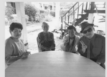
巴瑯奶奶(左2)第一次來教會