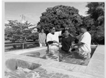
泰菊姐妹受洗歸主