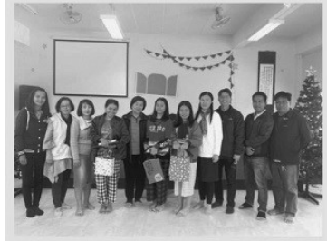
泰菊及兩個女兒受洗感恩