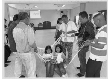
父親節福音主日親子遊戲