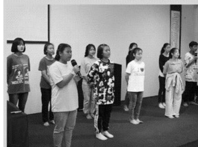
中文學校結業式 高班學生演唱「少年」