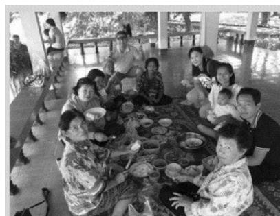
家庭小組一起出遊聚會