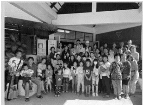
2020全教會退修會圓滿結束