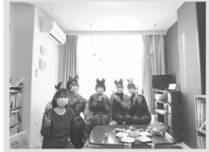
仙台荒井家的聖誕會