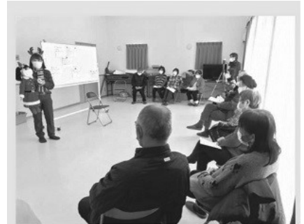
仙台東久保田的聖誕會