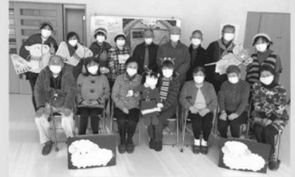
仙台東久保田的聖誕會