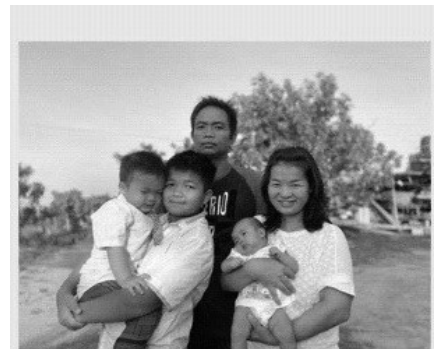
博益及尤善全家福