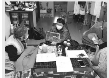
石卷番茄奶奶家的聖誕會