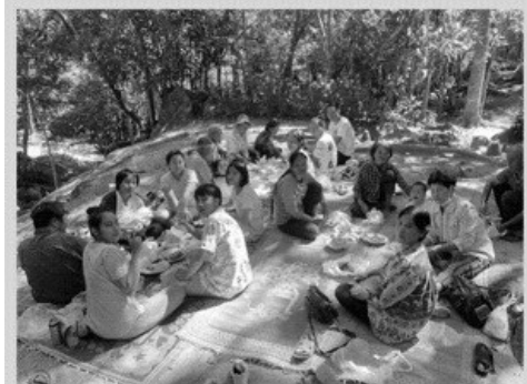
退修會一起到溪邊踏青野餐